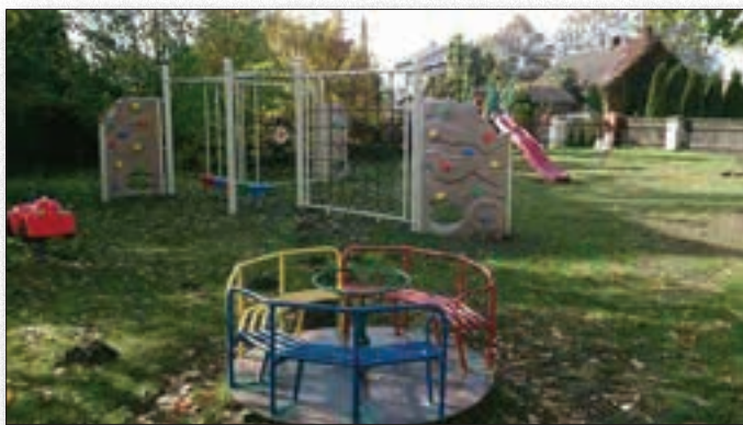
Nowy plac zabaw przy Szkole Podstawowej w Kaczkowie Starym

złożone zostały trzy wnioski o dotację w wysokości łącznie 30 000 zł. Dotacje stanowiły 50 % kosztów wykonania zadań. Dzięki pozyskanym funduszom świetlica wiejska przy ul. Czuraj w Broku zyskała nowe łazienki oraz parking przed budynkiem. Całkowity koszt realizacji zadania w sołectwie Czuraj wyniósł 22 256,29 zł. Otrzymane środki pozwoliły na urządzenie przy Szkole Podstawowej w Kaczkowie Starym placu zabaw dla dzieci. Koszt wyposażenia placu zabaw oraz wykonania chodnika przy Szkole stanowił kwotę 21 955,15 zł. W ramach Programu pozyskane zostały również fundusze na zagospodarowanie zieleni na Placu Kościelnym w Broku. Dotacja pozwoliła na wykonanie instalacji nawadniającej oraz urządzenia na nowo trawników. Na realizację zadania wydatkowano kwotę 23 341,00 zł.