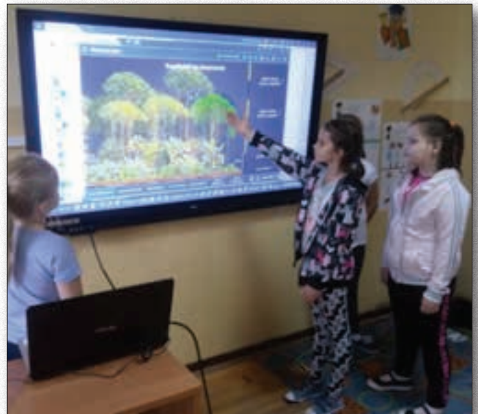
Zajęcia lekcyjne z wykorzystaniem nowoczesnego monitora interaktywnego