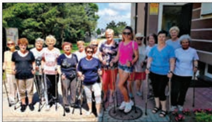
Aktywny spacer Seniorów z kijkami

stosowania odpowiedniej diety, a także poznania domowych sposobów na pyszne i bogate w witaminy koktajle.