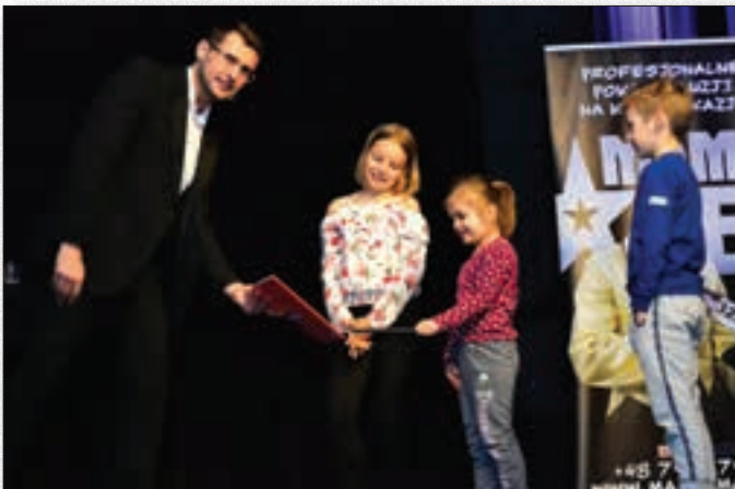
Pokaz iluzji z uczestnikiem "Mam Talent"