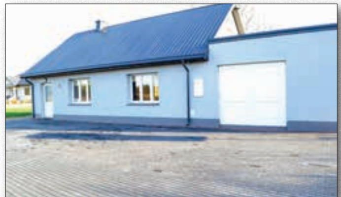
Parking przed Świątlicą wiejską przy ul. Czuraj

Podobnie jak w roku ubiegłym, w roku 2019 Urząd Marszałkowski Województwa Mazowieckiego uruchomił Mazowiecki Instrument Aktywizacji Sołectw. W ramach Programu