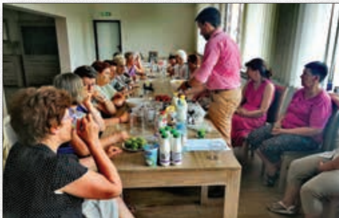
Spotkanie z dietetykiem

Dużym zainteresowaniem cieszą się spotkania z dietetykiem. Jest to doskonała okazja do zwiększenia wiedzy dotyczącej zdrowego odżywiania, dbania o regularność posiłków,