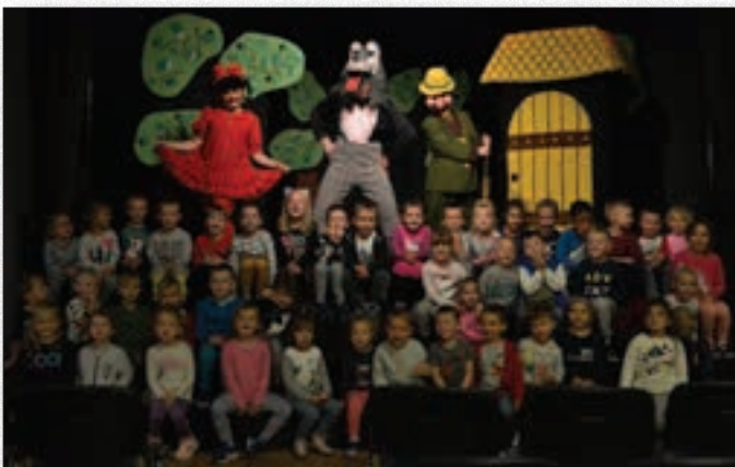
Spektakle teatralne dla dzieci