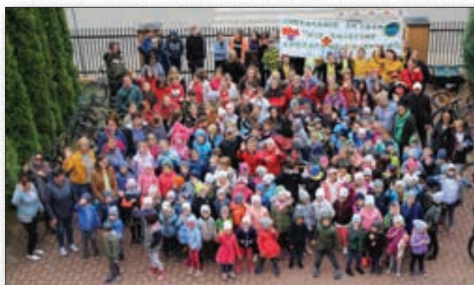
Jak co roku uczniowie czynnie biorą udział w akcji "Sprzątanie Świata"