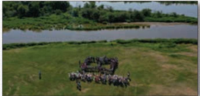
Akcja masowego czytania nad rzeką

Zamiłowaniem do książek chcemy również zachęcić kolejnym projektem, tym razem naszych najmłodszych mieszkańców. Dla dzieci w wieku od 3 do 6 lat i rodziców