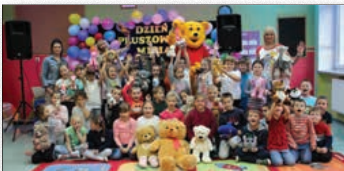
Wesołe zabawy podczas "Dnia Pluszowego Misia"