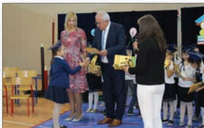
Uroczyste obchody świąt i wydarzeń szkolnych - tu Ślubowanie Pierwszoklasistów