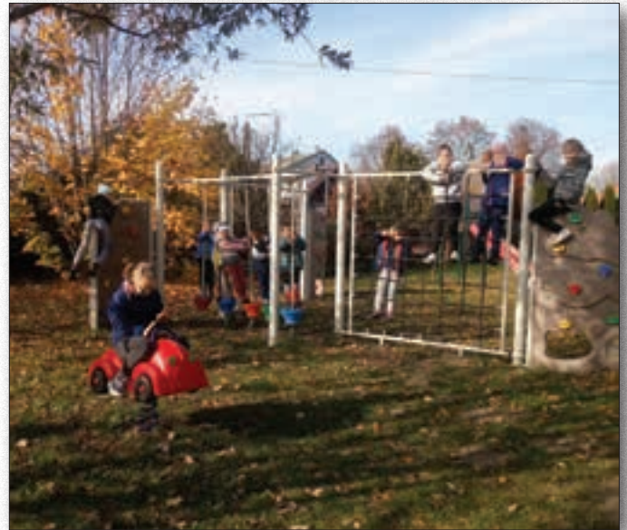
Nowy plac zabaw dla dzieci w Kaczkowie Starym

Mocne strony dominują nad słabymi, co dostrzegają rodzice i mieszkańcy wsi, którzy są dumni, że na ich terenie działa szkoła podstawowa i przedszkole.