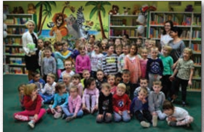
Obchody Dnia Bibliotekarza