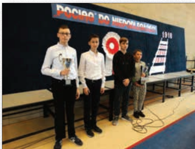
Zwycięzcy konkursów powiatowych: w strzelectwie i historycznym