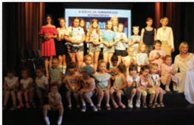
Gminny "Mam Talent" zawsze cieszy się ogromną sympatią uczestników