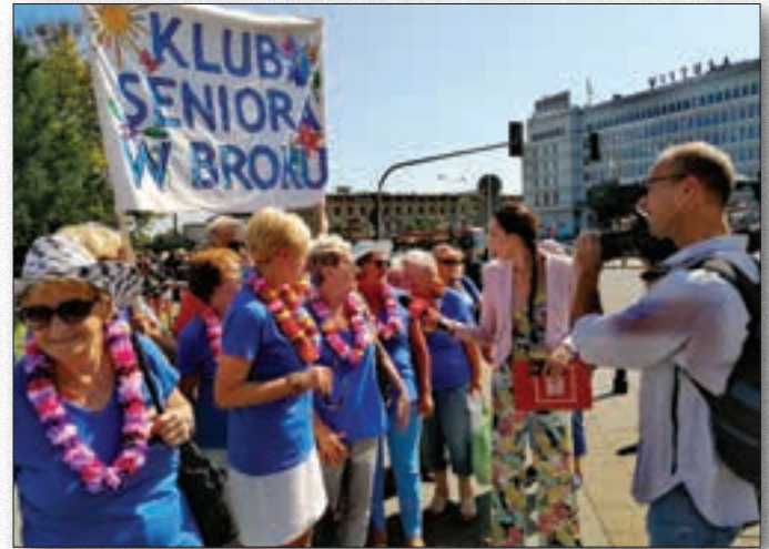
Uczestnicy Klubu na VI Ogólnopolskiej Paradzie Seniorów w Warszawie

Bogata oferta Klubu Seniora zawiera również wycieczki. Uczestnicy mieli możliwość obejrzenia spektakli teatralnych w Warszawie oraz pokazów kinowych w Ostrowi Mazowieckiej i w Wyszkowie. Oprócz krótkich wyjazdów kulturalnych odbyły się dłuższe, całonocne. W maju uczestnicy Klubu Seniora wzięli udział w wycieczce do Ziołowego Zakątka, znajdującego się w Korycinach. Tam czekał na nich spacer po Podlaskim Ogrodzie Ziołowym i warsztaty ziołowe.