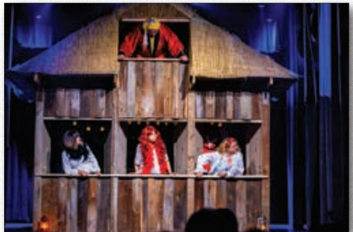
Spektakl teatralny „Serenada”