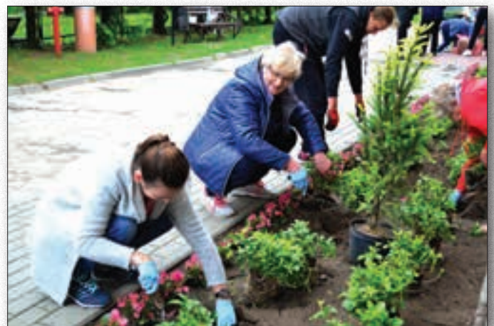
Warsztaty ogrodnicze z Klubem Seniora