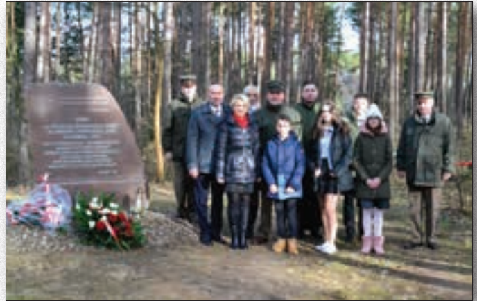
Złożenie kwiatów, przy symbolicznej Tablicy poświęconej Żołnierzom Wyklętym umiejscowionej w lesie na terenie cmentarza wojennego przy trasie Brok – Matkinia