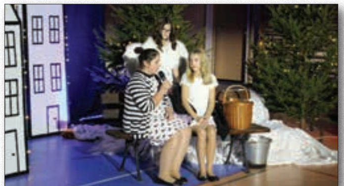
Uczniowie z brokowskiej szkoły występowali dla Samotnych Mieszkańców naszej gminy