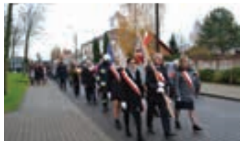
OBCHODY ŚWIĄT NARODOWYCH