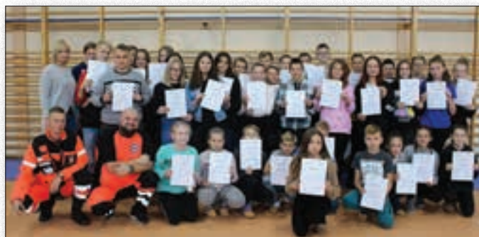
Uczniowie z certyfikatami ukończenia kursu pierwszej pomocy przedmedycznej

Wymienione powyżej powzięte inicjatywy oraz działania stanowiły spójną całość, co pozwoliło w ubiegłym roku uzyskać efekt synergii w poszczególnych obszarach opracowanej przez dyrekcję szkoły strategii funkcjonowania i rozwoju zespołu szkół. W ich realizacji najważniejsze dla szkoły stało się zagwarantowanie uczniom zarówno stosownych warunków nauki, dostępu do nowoczesnych metod nauczania, poszukiwanie różnorodnych form aktywizacji uczniów, unowocześnianie bazy dydaktycznej (doposażenie szkoły w pomoce multimedialne), ale także pogłębianie talentów poprzez uczestniczenie w nowych i kreatywnych formach kształcenia. Taka strategia rozwoju zaowocowała szeregiem ciekawych inicjatyw, projektów oraz współpracą z instytucjami i podmiotami zewnętrznymi, wspomagającymi pozyskanie umiejętności samokształcenia i indywidualnego rozwoju. Przyczyniło się to do sukcesów w konkursach, zarówno wiedzy, jak i sportowych, rozwojem osobistym oraz wzorową postawą obywatelską, jaką reprezentuje młodzież uczęszczająca do Zespołu Publicznych Placówek Oświatowych w Broku.