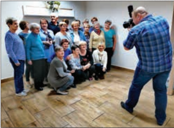
Cotygodniowe warsztaty fotograficzne