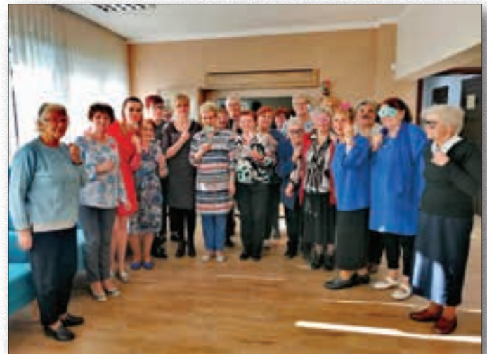
Spotkanie integracyjne Seniorów

To wydarzenie przekroczyło wszelkie oczekiwania uczestników brokowskiego Klubu Seniora. Ogromne pokłady energii towarzyszyły wszystkim, którzy wzięli udział w paradzie. Reprezentacja Klubu z Broku przygotowywała się do wyjazdu ponad miesiąc. Na zajęciach z rękodzieła seniorzy sami wykonali hawajskie, kolorowe naszyjniki oraz wielki transparent, który dumnie pokazywał nazwę naszej miejscowości. Dodatkowo, znakiem rozpoznawczym grupy były jednolite koszulki z herbem Broku oraz napisem Klub Seniora.