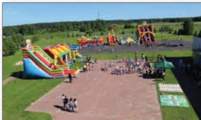
Dzień Dziecka jest zawsze dniem pełnym wrażeń i niespodzianek

Z racji rozszerzania oferty edukacyjnej szkoły dbamy o jakość edukacji na każdym poziomie. Bierzymy pod uwagę, że świat wokół nas nieustannie się zmienia, tak również metody pracy w szkole powinny się zmieniać i dostosowywać do wymagań współczesnego świata. Opracowywanych jest wiele programów nauczania stosujących nowoczesne metody pracy w szkole. My też konsekwentnie wprowadzamy ich z roku na