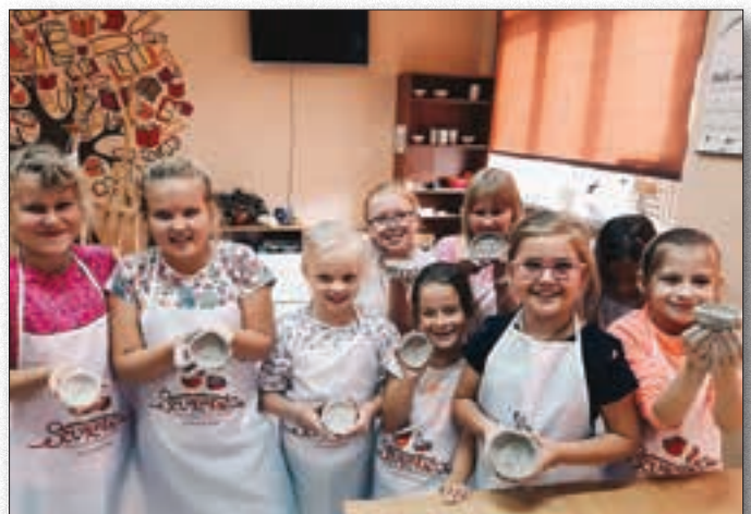
Młodzi uczestnicy pracowni ceramicznej

Pracownia ceramiczna jest profesjonalnie wyposażona i w pełni przygotowana do realizacji ceramicznych projektów. Uczniowie poznają tu cały proces projektowy: począwszy od szkicu aż do gotowego produktu. Prace wykonują w glinie oraz glinie lejnej, a modele sporządzają w gipsie. Podczas warsztatów tworzą ręcznie unikatowe przedmioty wg autorskiego projektu,