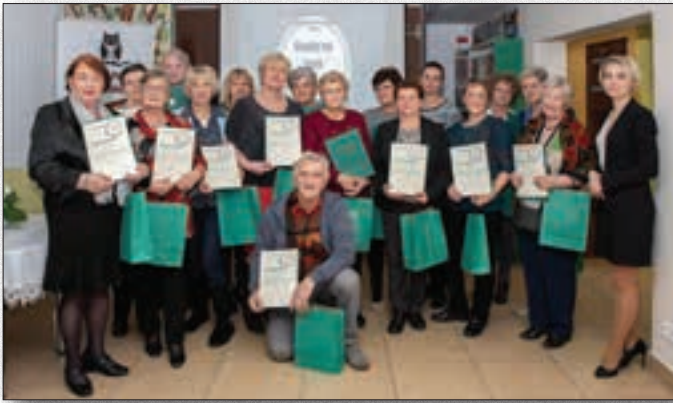
Uczestnicy kursu "O finansach w bibliotece"