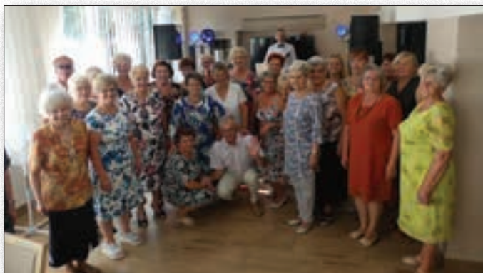
Integracyjny wieczorek muzyczno-taneczny

Dwa razy w tygodniu Klubowicze korzystają z usług rehabilitanta. Podczas tych zajęć wykonywana jest seria ćwiczeń, poprawiająca stan fizyczny seniorów. Dodatkowo w trakcie spotkań z rehabilitantem każdy klubowicz ma możliwość skorzystania z masażu, który dopasowany jest do jego potrzeb oraz indywidualnych konsultacji i bieżącego omówienia stanu swojego zdrowia.