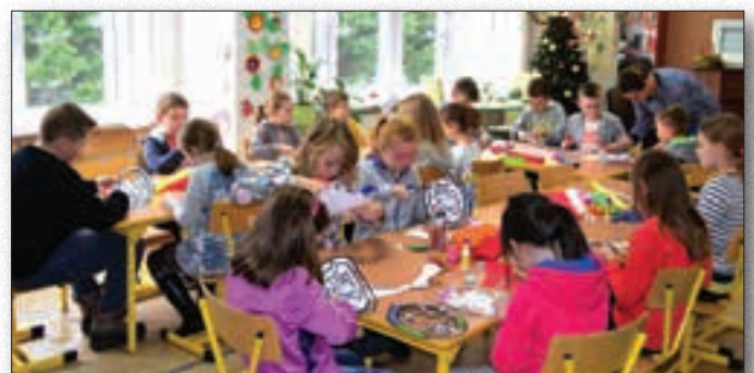
Kreatywne ferie zimowe