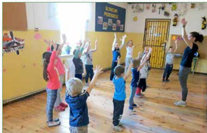
Przedszkolaki na zajęciach tanecznych

W przedszkolu odbywają się także dodatkowe zajęcia ruchowe prowadzone pod czujnym okiem instruktorów, są to zajęcia taneczne oraz Karate Kyokushin. W przedszkolu odbywają się również zajęcia z integracji sensorycznej.