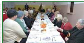
Wigilia dla Samotnych w Szkole w Broku

nosprawnego; rozpoczęcia roku szkolnego; podjęcia przez dziecko nauki w szkole poza miejscem zamieszkania.