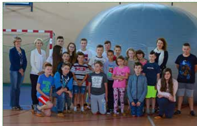
Seans astronomiczny w mobilnym planetarium

z walorami przyrodniczymi i historycznymi tego terenu oraz był okazją do rozwijania umiejętności prowadzenia obserwacji w środowisku naturalnym. Dodatkową atrakcją wycieczki było zwiedzanie słynnej Twierdzy Osowiec.