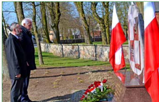
Władze Samorządowe oddały hołd Ofiarom Zbrodni Katyńskiej i Tragedii Smoleńskiej