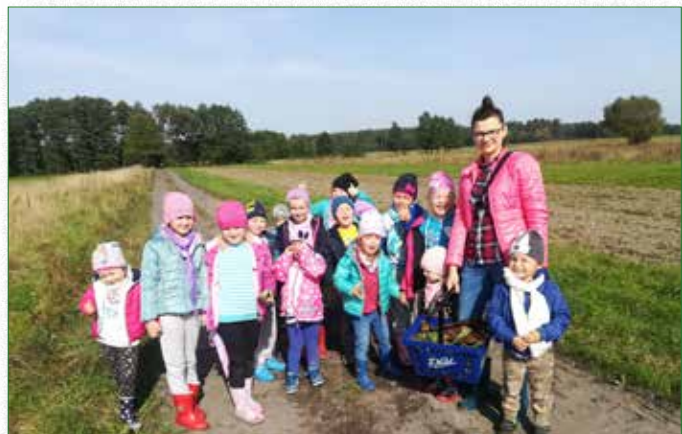
Wycieczka Przedszkolaków do lasu

We wrześniu Przedszkolaki odbyły wycieczkę do pobliskiego lasu po „dary jesieni”. Podczas spaceru obserwowały przyrodę - rozróżniały drzewa iglaste i liściaste. Wsłuchiwały się w odgłosy jesiennego lasu, a także zbierały skarby lasu - grzyby, żółędzie, kasztany, szyszki, kolorowe liście, korę z drzew. Wy-