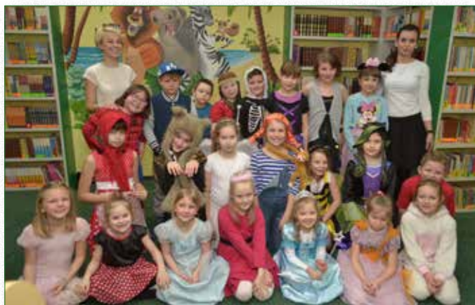
Zabawa karnawalowa w bibliotece

W przedsięwzięciu wzięło udział 124 osoby. Tradycyjnie w cza-