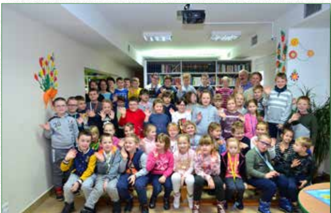
Uczestnicy spotkania z podróżnikami

W spotkaniu wzięło udział 50 osób. Podróżnicy zabrali dzieci z klasy I-III Szkoły Podstawowej w Broku na wędrowkę po Szwecji śladami bohaterów słynnych powieści dla dzieci.