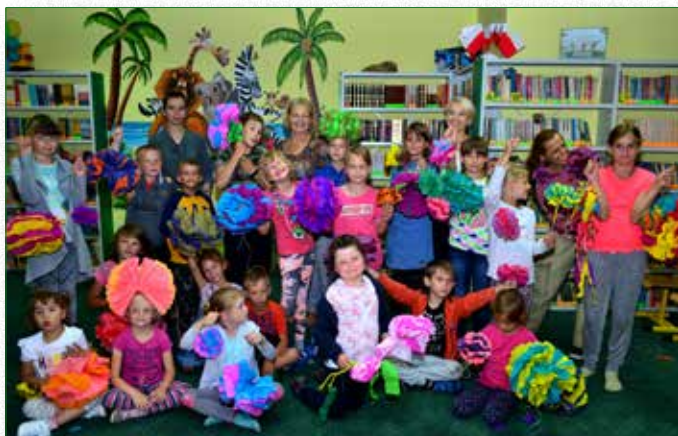
Uczestnicy wakacyjnych zajęć w bibliotece