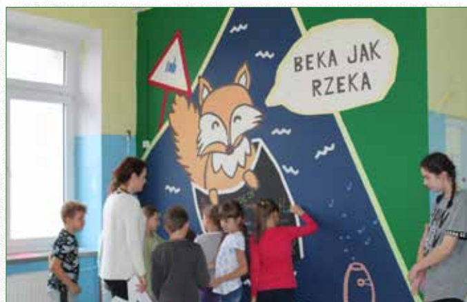
Mural wykonany przez uczniów na korytarzu szkolnym zwierzył projekt „Róbmy sztukę”