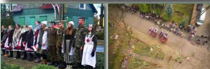
Widowiskowa inscenizacja patriotyczna w wykonaniu uczniów ZPPO w Broku