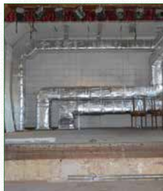
Sala widowiskowa przed remontem

Pieniądże na remont sali pozyskaliśmy z puli Regionalnego Programu Operacyjnego na lata 2014-2020, w kwocie 580 562,17 zł.