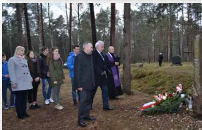
Obchody Dnia "Żołnierzy Wykolejonych"