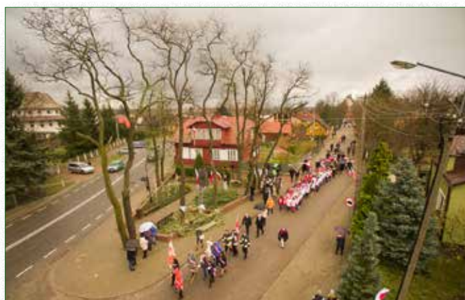
Patriotycznym akcentem była żywa flaga państwowa sformowana przez uczniów brokowskiej szkoły