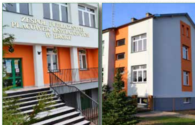
Nowa elewacja budynku szkoły