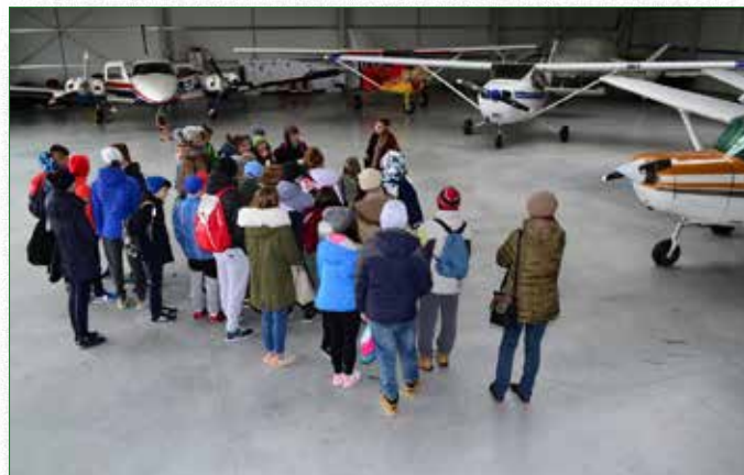
Wycieczka edukacyjna na lotnisko Grądy

nia wykorzystywane w pracy strażaków. Ogromną radość sprawiło dzieciom lanie wody węzłem strażackim, gdzie przez chwilę wszyscy mogli poczuć się jak strażacy.