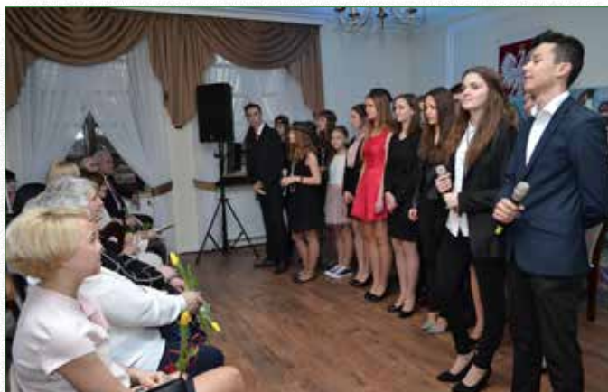
Montaż słowno-muzyczny w wykonaniu uczniów ZPPO w Broku