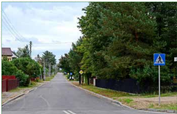
Nowy asfalt na ul. Narutowicza

Tegoroczny raport dotyczący poziomu inwestycji samorządowych przygotowany przez czasopismo „Wspólnota” dowodzi, że w Gminie Brok inwestycje idą pełną parą.