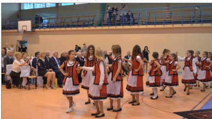
Występ Młodzieżowego Zespołu Ludowego Folk Music Brok podczas obchodów Jubileuszowych Brylantowych i Złotych Godów

ich historii, pasji, zainteresowań, a przede wszystkim spróbowania swoich sił w organizacji wydarzenia o lokalnym zasięgu.