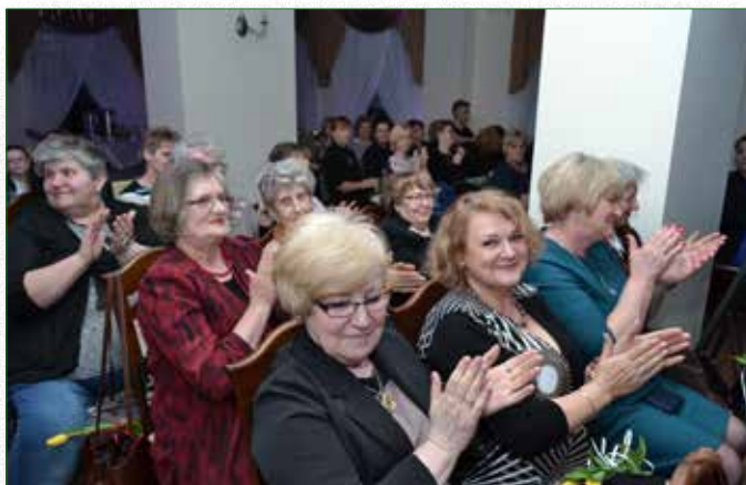
Panie wypełniły salę konferencyjną po brzegi