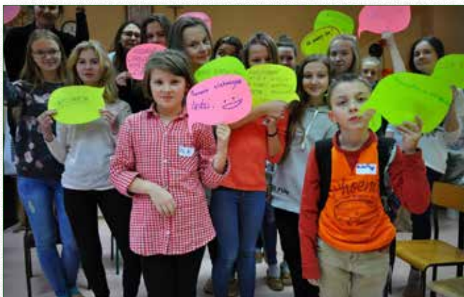
Uczestnicy projektu „Młody Obywatel”