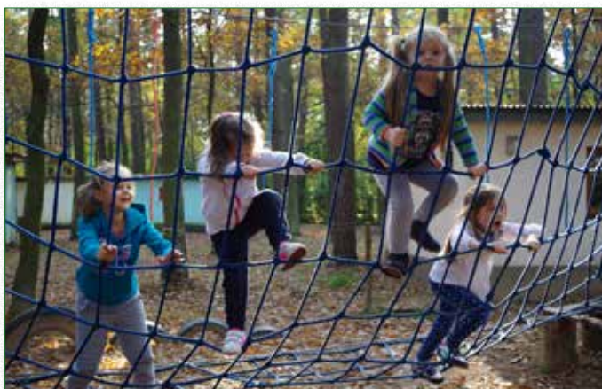
Harce w Parku linowym NOE

18 października odbyła się wycieczka do Parku Linowego NOE w Broku. Park Linowy jest miejscem, gdzie dzieci nie tylko świetnie się bawiły, ale również wyniosły z tej zabawy