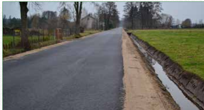
Nowa droga Kuskowizna - Kaczkowo Stare

W listopadzie br. zakończona została realizacja inwestycji pod nazwą: „Przebudowa drogi powiatowej nr 2638W Kuskowizna – Kaczkowo Stare” wykonywana przez Powiat Ostrowski. Inwestycja współfinansowana była również przez Gminę Brok, która ze swoich środków budżetowych udzieliła pomocy finansowej Powiatowi Ostrowskiemu w wysokości 250 000.00 zł.