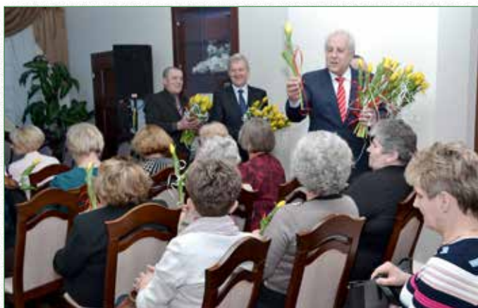
Wszystkie Panie otrzymały kwiaty od Burmistrza