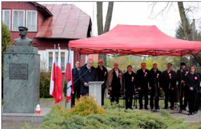
Uroczyste obchody Uchwalenia Konstytucji 3-Maja

Następnie w Bibliotece Publicznej w Broku wyświetlony został film dokumentalny o Danucie Siedzikównie ps. „Inka” pt. „INKA - są sprawy ważniejsze niż śmierć” w reżyserii Jacka Frankowskiego.