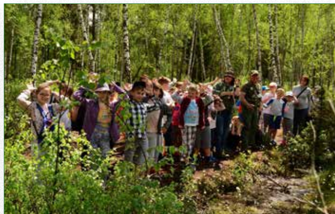
Wycieczka przyrodnicza do Biebrzańskiego Parku Narodowego