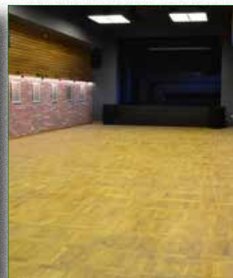
Tak wygląda sala po remoncie