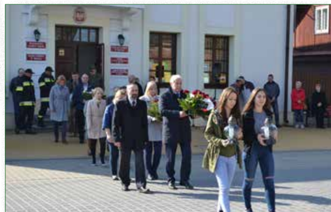
Delegacje uczestniczące w obchodach rocznicowych Zbrodni Katyńskiej oraz Tragedii Smoleńskiej