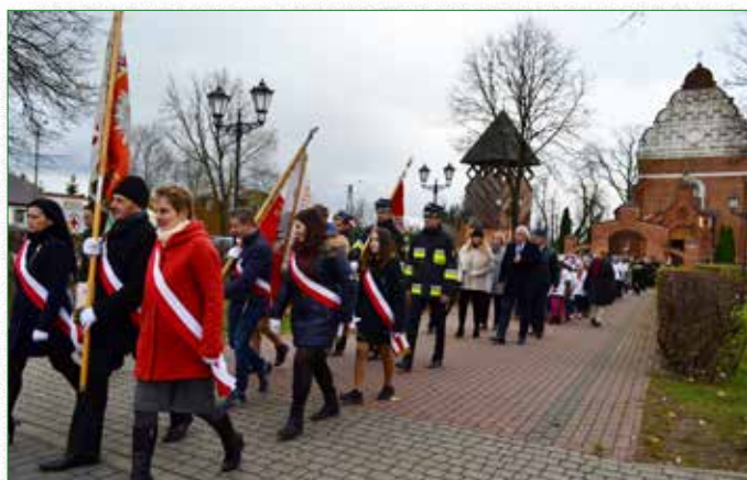
Obchody Narodowego Święta Niepodległości 11 listopada