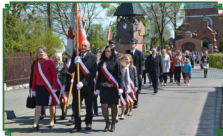
Przemarsz przed pomnik Marszałka Józefa Piłsudskiego