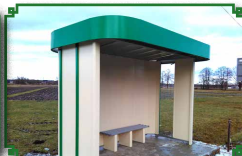
Budowa wiat przystankowych