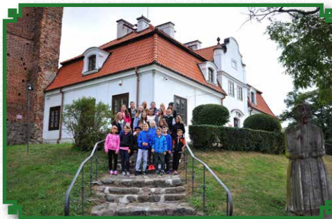
Wyjazdowy plener malarski