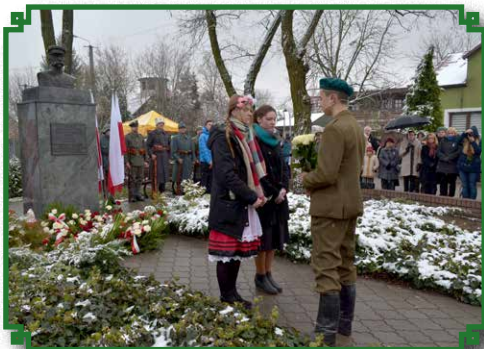
Inscenizacja Patriotyczna w wykonaniu uczniów z ZPPO w Broku