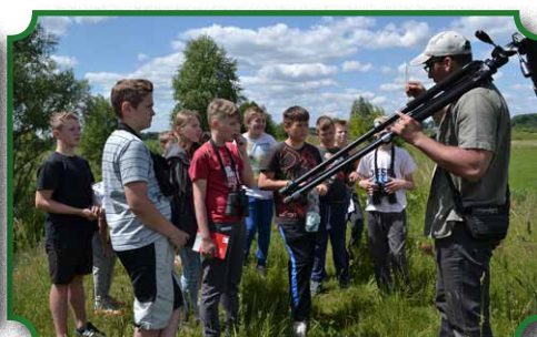
Warsztaty ornitologiczne nad Bugiem