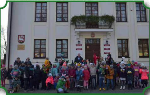
Korowód postaci z bajek z wizytą u Burmistrza