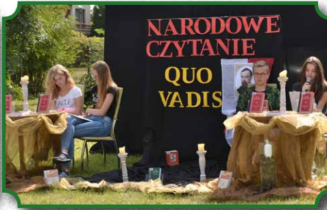
Narodowe Czytanie "Quo Vadis"