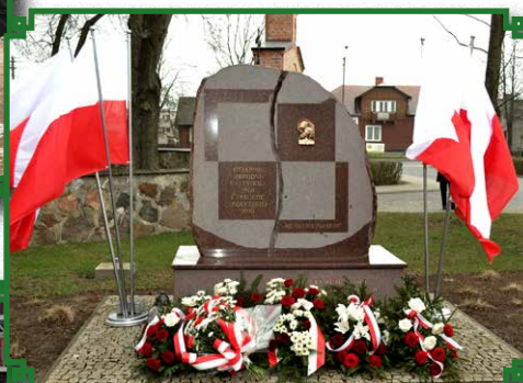
Obelisk upamiętniający Ofiary Tragedii Smoleńskiej i Zbrodni Katyńskiej