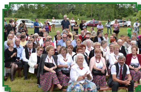
Festyn Rodzinny 2016

Na początku rozegrany został mecz piłki nożnej o Puchar Burmistrza Miasta i Gminy Brok pomiędzy mieszkańcami Kaczkowa Starego i Kaczkowa