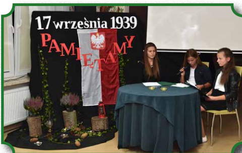
Pokaz filmu "Krew na bruku. Grodno 1939"