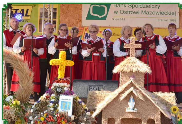
Dożynki Powiatowe - występ Zespołu Ludowego „Jarzębina”

Dużym zainteresowaniem uczestników cieszyło się stoisko promocyjne Gminy Brok. Pracownicy Urzędu Gminy w Bro-