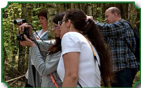
Dwumiesięczne warsztaty fotograficzne