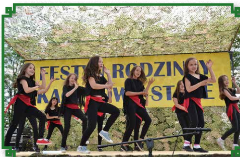
Festyn Rodzinny 2016 - występy uczniów

Niezwykle ważnym wydarzeniem w życiu szkoły był Festyn Rodzinny pod hasłem „Podaruj sobie i swoim bliskim trzy godziny niedzielnego popołudnia...”, który odbył się 12 czerwca.