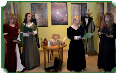
Wystawa "Kronikarze piszą... Chrzczenie Polski"