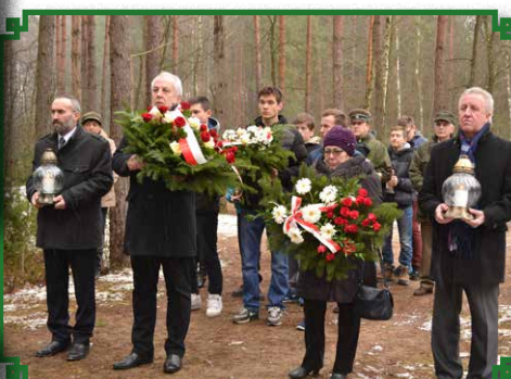
Uroczyste złożenie wiązanek kwiatów przed Pomnikiem Żołnierzy Wykłych