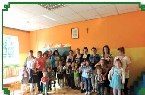
Grupa Przedszkolaków z Rodzicami