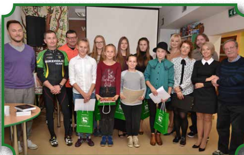
Posiady Witkiewiczowskie w Bibliotece