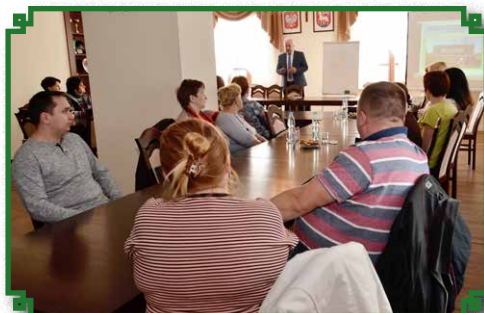
Szkolenie dla przedsiębiorców w Ratuszu Miejskim

Nałogi stanowią poważny problem. Uzależnienia alkoholowe, narkotykowe i nikotynowe są obecne w każdym mieście, każdej gminie i miejscowości. Dlatego też bardzo ważna jest profilaktyka.