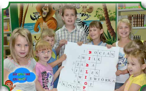
Wakacje z biblioteką