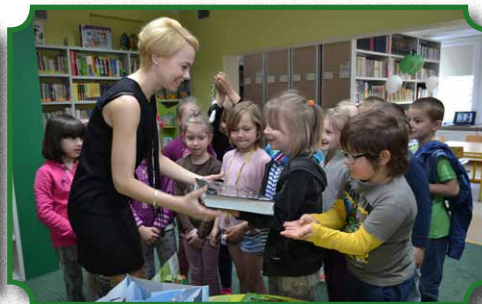
Spotkania z uczniami z ZPPO w Broku