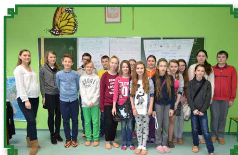
Zajęcia „Wolni od przemocy” w ZPPO w Broku

W marcu br., w ZPPO w Broku zostały przeprowadzone zajęcia z programu „Wolni od przemocy”. Zajęcia z młodzieżą w formie warsztatów, przeprowadziły doświadczone trenerki: Ma-