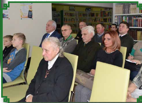
Prelekcja w Bibliotece Publicznej