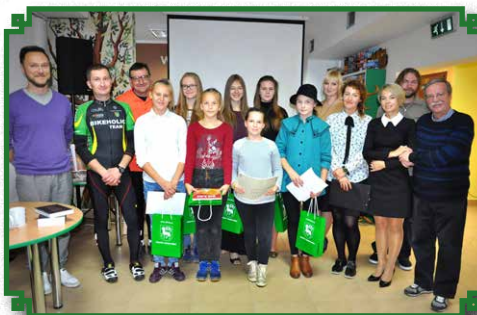
Posiad Witkiewiczowski w Bibliotece Publicznej

We wrześniu również dzięki inicjatywie Ostrowskiej Masy Krytycznej i Tusiemałuje szkoła podjęła współpracę z Instytutem Witkacego przy organizacji Posiadu Witkiewiczowskiego w ramach II Rajdu Rowerowego „W jak Witkacy”.