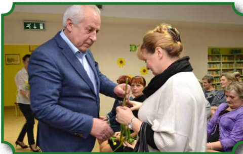
Wszystkie Panie otrzymały kwiaty od Burmistrza