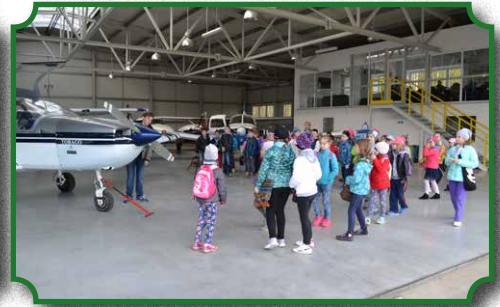
Wycieczka uczniów na lotnisko Grądy