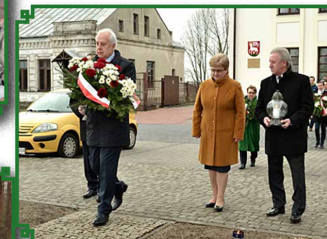
Złożenie wiązanek kwiatów przed pomnikiem Ofiar Tragedii Smoleńskiej i Zbrodni Katyńskiej przez delegację Władz Samorządowych

Tradycyjnie gminne obchody rozpoczynają się Mszą Św. w intencji Ojczyzny w Kościele Parafialnym pw. Św. Andrzeja Apostoła. Stałym punktem uroczystości jest wspólny przemarsz w asyście Poczty Sztandarowej przed Pomnik Marszałka Józefa Piłsudskiego, gdzie następuje złożenie kwiatów przez obecne delegacje. Uroczystościom towarzyszą występy artystyczne uczniów z Zespołu Publicznych Placówek Oświatowych w Broku. W tym roku Mieszkańcy mieli okazję obejrzeć okolicznościową inscenizację patriotyczną zaprezentowaną przez brokowską młodzież.