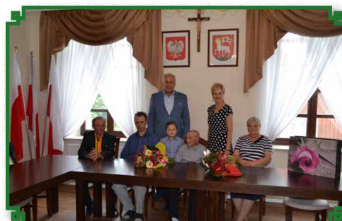
Spotkanie z Jubilattem w Ratuszu Miejskim

Z okazji 101 urodzin Szanowny Jubilat otrzymał najlepsze życzenia - dużo dobrego zdrowia, pogody ducha na co dzień, kwiaty i prezent. Były pamiątkowe zdjęcia,