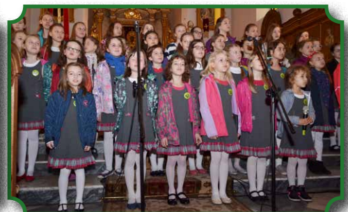
Koncert dziecięcego Chóru "Mille Voci" w Warszawie