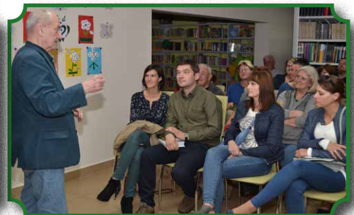
Spotkanie ze znanym polskim podróżnikiem - Jackiem Patkiewiczem