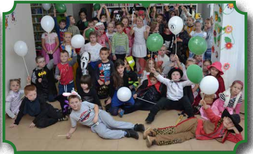
Dzień postaci z bajek- wesole zabawy w bibliotece