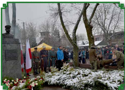
Inscenizacja Patriotyczna -11 listopada