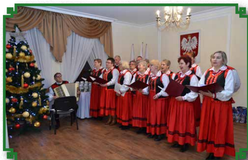
Wieczere umiłątą kolędy w wykonaniu Zespołu "Jarzębina"

Zadaniem pomocy społecznej jest nie tyle rozdawanie środków finansowych, co znalezienie takiego rozwiązania, które pomoże osobom potrzebującym nauczyć się samodzielności w radzeniu sobie z wyhodzeniem z trudnej sytuacji życiowej.