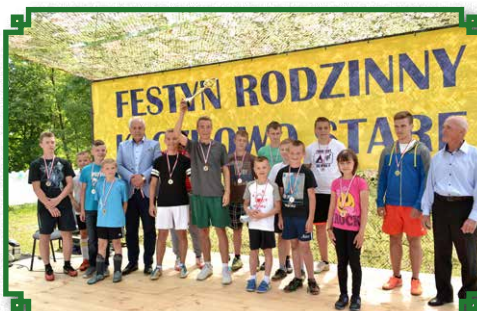
Festyn Rodzinny 2016 - uhonorowanie zwycięzców

Na początku rozegrany został mecz piłki nożnej o Puchar Burmistrza Miasta i Gminy Brok pomiędzy mieszkańcami Kaczkowa Starego i Kaczkowa