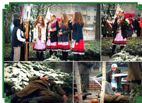
Inscenizacja Patriotyczna przed Pomnikiem Marsz. J. Piłsudskiego - 11 listopada 2016 r.

W ramach rozwijania zainteresowań historycznych 24 października 2016 r. uczestniczyliśmy w projekcie edukacyjnym poświęconym Rotmistrzowi Pileckiemu. Projekt realizowany był przez Międzygminny Związek „Ziemia Ostrowska”.