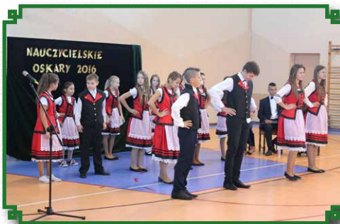
Zespół Ludowy Folk Music Brok