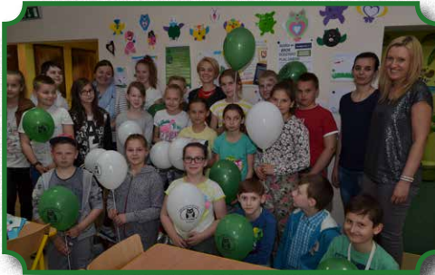
Spotkania z uczniami z ZPPO w Broku