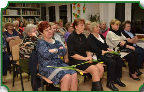
Gminny Dzień Kobiet