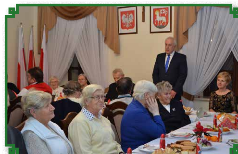
Wigilia dla Samotnych w Ratuszu Miejskim - Rok 2015

Co roku OPS organizuje spotkania wigilijne dla osób samotnych z terenu miasta i gminy, które stwarzają możliwość bliższego poznania, rozszerzania wzajemnych relacji i zacieśniania więzi.