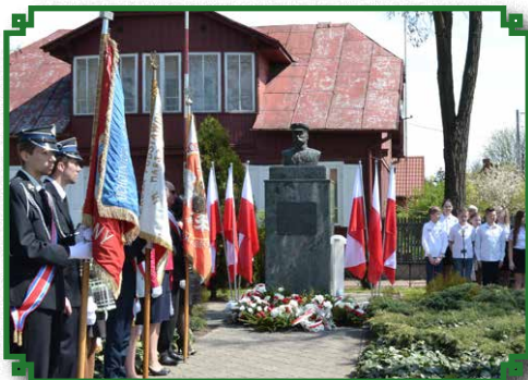
Uroczyste Obchody Uchwalenia Konstytucji 3-go Maja