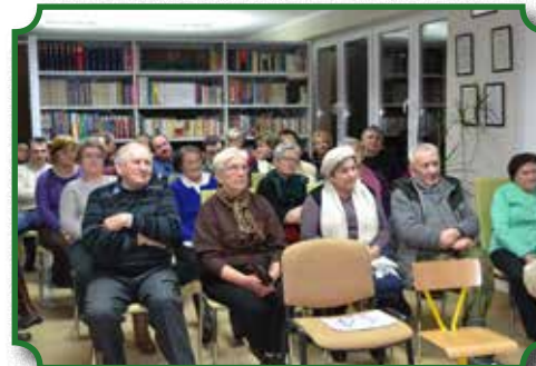
Mieszkańcy podczas prelekcji nt. historii Kaczkowa