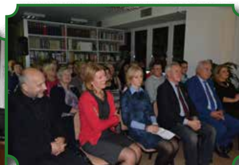
Wieczornica Patriotyczna z okazji Narodowego Święta 11 listopada.