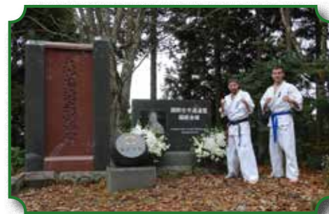
Wyjazd Zawodnika BKKK na Mistrzostwa Świata do Tokio

Uczniowie z naszej szkoły odnosili sukcesy w różnych konkursach na szczeblu powiatu i kraju.