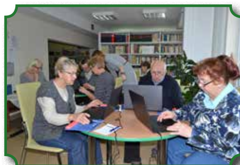
Szkolenia komputerowe dla seniorów

Od kwietnia 2014 roku działa oficjalna strona biblioteki ( www.biblioteka.brok.pl ), gdzie zapraszamy do zapoznania się z aktualnymi wydarzeniami w bibliotece. W listopadzie br. został stworzony fanpage biblioteki na Facebooku, na którym zamieszczane są fotorelacje z imprez i zajęć bibliotecznych.