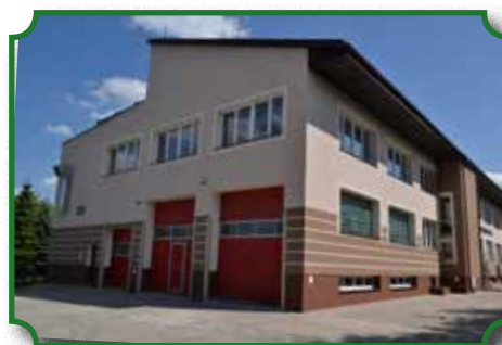
Zrewitalizowany budynek przy ul. Pułtuskiej

W okresie od 20 marca 2015 r. do 13 sierpnia 2015 r. wykonywana była inwestycja termomodernizacji budynków użyteczności publicznej w naszej Gminie: budynku po byłym Domu Kultury - obecnie siedziba Biblioteki Publicznej i Ochotniczej Straży Pożarnej przy ul. Pułtuskiej w Broku oraz Szkoły Podstawowej w Kaczkowie Starym. Celem przeprowadzenia inwestycji jest wzrost efektywności energetycznej obiektów. W ramach zadania została przeprowadzona całkowita modernizacja systemów ogrzewania budynków (poprzez likwidację starej instalacji centralnego ogrzewania oraz wymianę starych pieców na ekologiczne kotły na pellet), docieplono ściany zewnętrzne i fundamenty budynków wraz z wykonaniem nowych elewacji. Ponadto w budynku przy ul. Pułtuskiej wymieniono