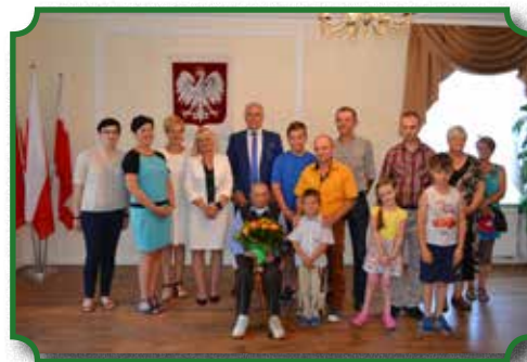
Uroczystość w Ratuszu Miejskim-100 -letnie urodziny Mieszkańca Broku

możliwość bliższego poznania, rozszerzania wzajemnych relacji i zacieśniania więzi.