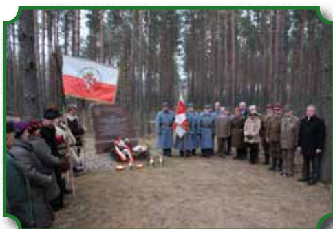
Obchody Narodowego Dnia Pamięci „Żołnierzy Wyklętych”