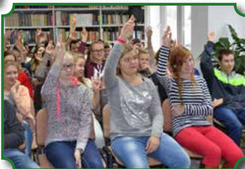
Aktywna młodzież podczas spotkania literackiego

We wrześniu 2015 roku biblioteka wyposażona została w nowoczesny sprzęt komputerowy i audiowizualny, poprawiający warunki rozwoju społeczeństwa informacyjnego. Aktualnie funkcjonuje pięć stanowisk komputerowych wyposażonych w nowoczesny sprzęt (słuchawki, kamerki wideo) i dostęp do Internetu. Korzystanie z tych stanowisk jest nieodpłatne. Cały budynek ma własną strefę Wi-Fi, która umożliwia użytkownikom