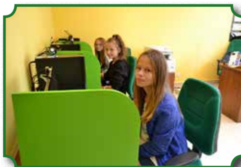
Nowoczesna pracownia komputerowa

Biblioteka Publiczna w Broku jest jedyną instytucją kultury w mieście i gminie Brok, która realizuje określone statusem zadania polegające na zaspokajaniu i rozwijaniu potrzeb edukacyjnych, kulturalnych i informacyjnych społeczności lokalnej. By w pełni realizować misję kulturalną i aktywizację społeczną konieczne jest wystąpienie szeregu czynników, które pozytywnie oddziałują na świadomość odbiorców. Obok dobrego księgozbioru i ciekawej oferty kulturalnej biblioteki ważną staje się jej lokalizacja, która umożliwi