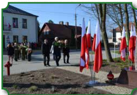
Obchody 75. rocznicy Zbrodni Katyńskiej i 5. rocznicy Katastrofy Smoleńskiej

Obelisk upamiętniający ofiary Katynia z 1940 r. i ze Smoleńska 2010 r. znajduje się przed Ratuszem Miejskim. Został poświęcony w 2014 roku.