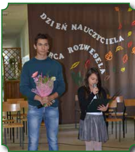
Uroczyste obchody Święta Edukacji Narodowej

Wskaźnikiem ważnego funkcjonowania szkoły jest wynik egzaminu gimnazjalnego, w którym osiągnęliśmy dobry wynik, który dał naszemu gimnazjum czwarte miejsce w powiecie wśród wszystkich gimnazjów. Odbyło się szereg konkursów szkolnych. Należą do nich: „Czytam sobie”, „Pocztówka Wielkanocna”, „Mam talent”, „Nie wydawaj, kreuj modę”.