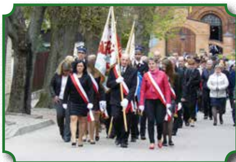
Uroczysty przemarsz pod Pomnik Marszałka Józefa Piłsudskiego

Obchody Narodowych Świąt w naszym mieście mają swoją tradycję i podniosły charakter. W roku 2015 pod pomnikiem Marszałka Józefa Piłsudskiego obchodzone były uroczystości związane z rocznicą uchwalenia Konstytucji 3-go Maja oraz Świętem Niepodległości 11 listopada. Obchody każdej uroczystości rozpoczyna uroczysta Msza Św. w intencji Ojczyzny w Kościele Parafialnym. Stałym punktem obchodów jest wspólny przemarsz w asyście Poczty Sztandarowych pod Pomnik naszego Wodza, gdzie następuje złożenie wiązanek kwiatów przez obecne delegacje