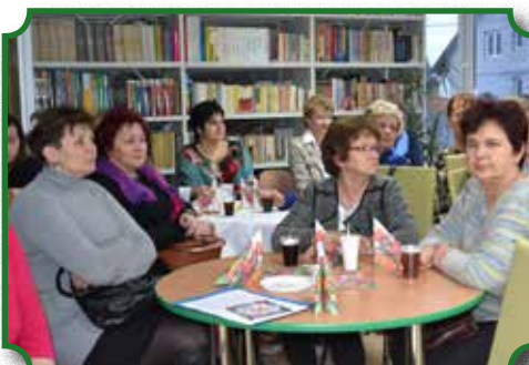
„Dzień Kobiet” w Bibliotece

Uznanie wśród mieszkańców i turystów budzi kompleksowa renowacja budynku przy ul. Pułtuskiej, w którym swoje siedziby ma Biblioteka i Ochotnicza Straż Pożarna. Na początku 2015 roku, dzięki uzyskanemu przez Gminę Brok dofinansowaniu z Narodowego Funduszu Ochrony Środowiska i Gospodarki Wodnej - system zielonych inwestycji, budynek zy-