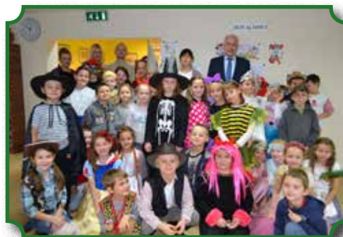
Świątowy Dzień Postaci z Bajek

Wnętrze biblioteki zaplanowano kładąc nacisk na funkcjonalność; obiekt zapewnia czytelnikom łatwość i komfort korzystania z biblioteki. Nowoczesny budynek stał się wizytówką miasta i gmi-