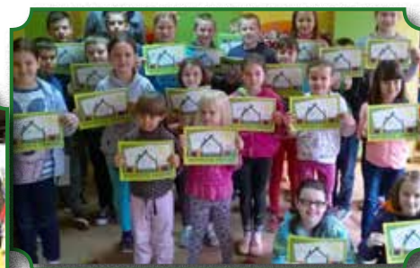
Zajęcia w ramach programu edukacyjnego „Bezpieczne Dziecko”

Warto pamiętać, że dzieci same potrafią rozwiązać swoje problemy, jeśli mają wokół siebie przyjaznych i wspierających dorosłych.