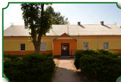
Nowa elewacja budynku Szkoły Podstawowej w Kaczkowie Starym