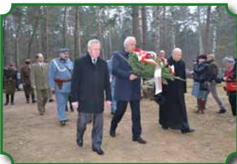
Uroczyste złożenie wiązanek pod pomnikiem Żołnierzy AK

W Eucharystii uczestniczyli: przedstawiciele Władz Samorządowych, na czele z Burmistrzem Miasta i Gminy Brok Mar-