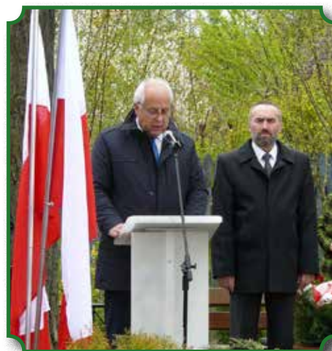
Uroczystość Uchwalenia Konstytucji 3-go Maja