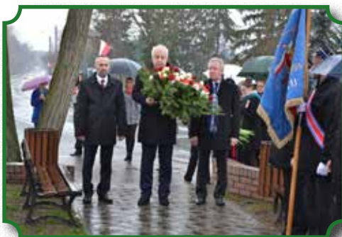
Obchody Narodowego Święta Niepodległości 11 listopada

szkolna, przedstawiciele organizacji społecznych oraz zebrani Goście i Mieszkańcy Miasta i Gminy.