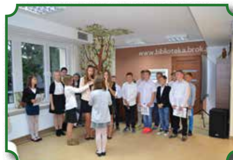
„Wieczór wspomnień” poświęcony Janowi Pawłowi II