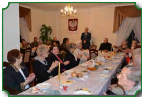
Spotkanie wigilijne w Ratuszu Miejskim w grudniu 2014 r.

Rok 2015 w działalności Gminnego Ośrodka Pomocy Społecznej w Broku to wykonywanie pracy opartej na kolejnych regulacjach przepisów prawa, to troska o ludzki los i odpowiedzialność za istniejące dysfunkcje w poszczególnych środowiskach. Poprzez ciągłe nowelizacje przepisów różnych ustaw pracownikom socjalnym przybywa dodatkowych obowiązków, a zakres udzielanych świadczeń ulega systematycznemu rozszerzaniu. Coraz więcej osób i rodzin korzysta ze wsparcia w ramach systemu zabezpieczenia społecznego, a katalog spraw regulowanych przez przepisy prawa pomocy społecznej jest obszerny. W roku 2015 uległy zmianie kryteria dochodowe w pomocy społecznej i świadczeniach rodzinnych, nastąpiły nowe procedury w postępowaniu z dłużnikami alimentacyjnymi i przeciwdziałaniu przemocy w rodzinie. Zmianami przepisów dotknięta została niemal każda sfera funkcjonowania Ośrodka Pomocy Społecznej w zakresie zwiększenia stopnia informatyzacji postępowania administracyjnego.