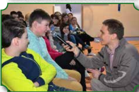
Warsztaty profilaktyczne z uczniami ZPPO w Broku

Gmina uczestniczyła także w programie „Zachowaj Trzeźwy Umysł”. Program skierowany jest do uczniów szkoły podstawowej i gimnazjum. Najbardziej zaangażowani uczniowie otrzymali nagrody, które zostały wręczone na rozpoczęciu roku szkolnego.