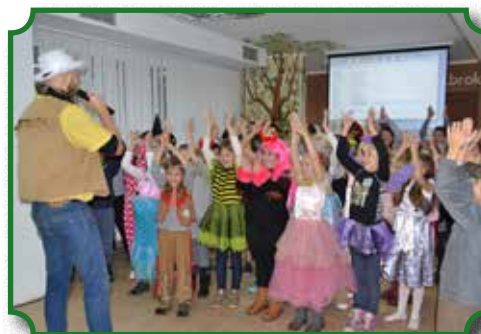
Światowy Dzień Postaci z Bajek

biblioteki. Zdecydowanie wzrosła liczba czytelników oraz liczba osób uczestniczących w bieżącej działalności biblioteki.