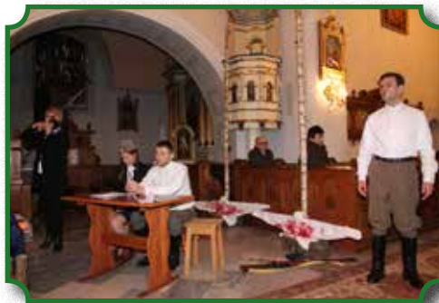
Widowisko dramatyczne podczas uroczystości Narodowego Dnia Pamięci „Żołnierzy Wyklętych”