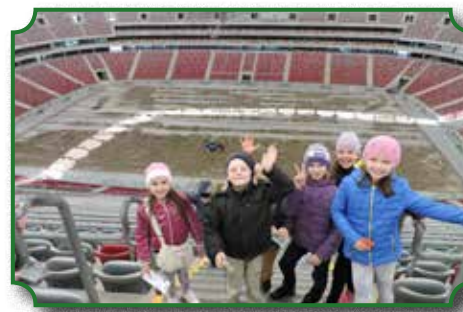
Wycieczka do Warszawy - Stadion Narodowy

Dzięki pozyskanym przez Gminę Brok dotacjom z Narodowego Funduszu Ochrony Środowiska i Gospodarki Wodnej została wykonana modernizacja systemu ogrzewania (poprzez likwidację starej instalacji centralnego ogrzewania oraz wymianę starego pieca na ekologiczny kocioł retortowy na pellet). Ocieplono wszystkie ściany zewnętrzne i fundamenty oraz wykonano nową elewację budynku.