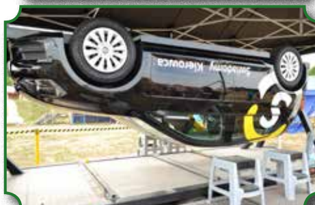
Stanowisko Mobilnego Centrum podczas Dni Broku 2015