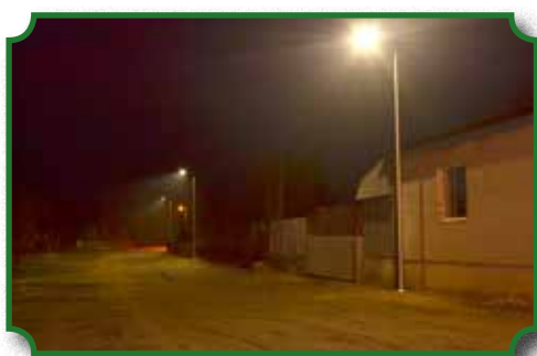
Oświetlona ulica w centrum miasta

Oprócz szeregu prac projektowych prowadzone są też inwestycje, na które pozwalają zasoby dochodów budżetu Gminy. Jedną z takich inwestycji jest budowa oświetlenia ulicznego w pasie łącznika pomiędzy ulicą Narutowicza a Dąbrowskiego. Odcinek ten jest najkrótszą drogą łączącą szkołę ze zgrupowanymi w pobliżu rynku sklepami.